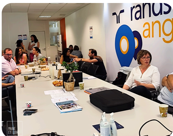
Rendez-vous des adhérents du club FACE

L'année 2023 a été riche en événements pour les entreprises du réseau du club. Deux rendez-vous adhérents ont permis de renforcer les liens entre les représentant.e.s d'entreprises. Deux Pitches de la RSE ont mis en lumière les acteurs du territoire qui proposent des solutions pour les engagements RSE. Enfin, deux "Impact Puissance 3" co-organisés avec l'ADECC et l'IRESA avec pour objectif d'améliorer et valoriser les impacts sociaux, sociétaux et environnementaux des structures présentes.