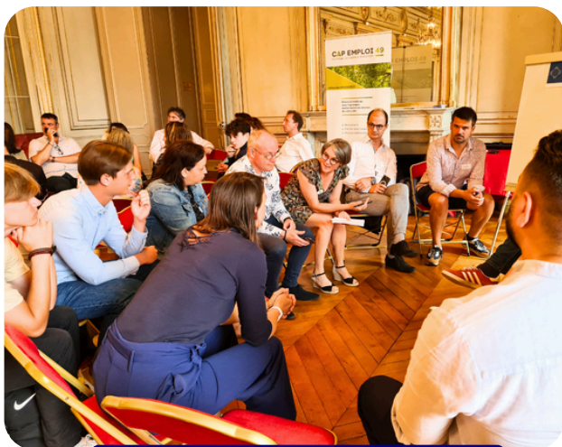
Lancement du collectif à la Préfecture

La politique publique de l'engagement des entreprises pour un monde inclusif et durable