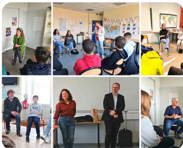
Intervention en classe dans un QPV