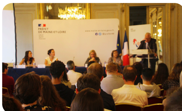
Présentation du PAQTE à la Préfecture de Maine-et-Loire

L'ADN de FACE Maine-et-Loire est de mobiliser les entreprises au service des plus vulnérables dont les habitant.e.s des QPV. Pour cela, dans chacune de nos actions, nous mettons une attention particulière à faire ce lien. Le PAQTE est un programme fil rouge, qui est incarné et présent dans notre quotidien que ce soit sur les sensibilisations aux entreprises, les actions emploi ou orientation/formation.