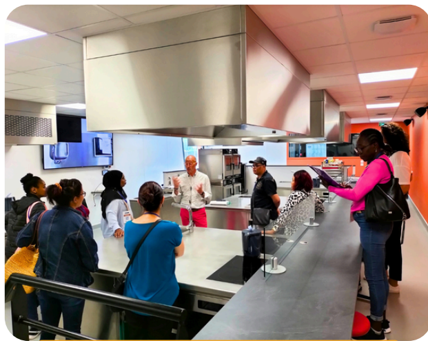
Parcours thématique sur les métiers du soin et de la restauration - FACEMPLOI 2023