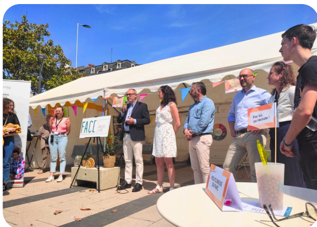
Discours des partenaires institutionnels

Co-construit par FACE Maine-et-Loire et le Groupe SNCF avec le soutien de la Région des Pays de la Loire, le Train de l'Emploi et de la Mobilité a eu lieu le jeudi 8 juin 2023. Un premier rendez-vous d'inauguration à Cholet en présence des partenaires et des écoles pour ensuite se poursuivre sur la ligne Cholet/Angers avec des rencontres entre professionnel.le.s, jeunes collégiens et demandeurs d'emploi.