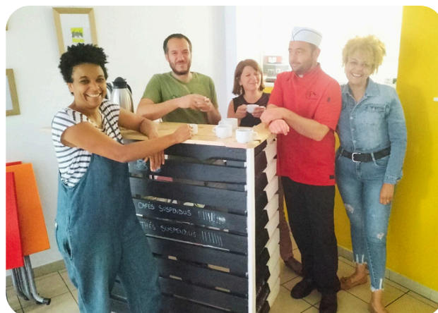
Atelier chez Resto Troc

Développer de nouvelles actions innovantes pour lutter contre l'exclusion dans les quartiers