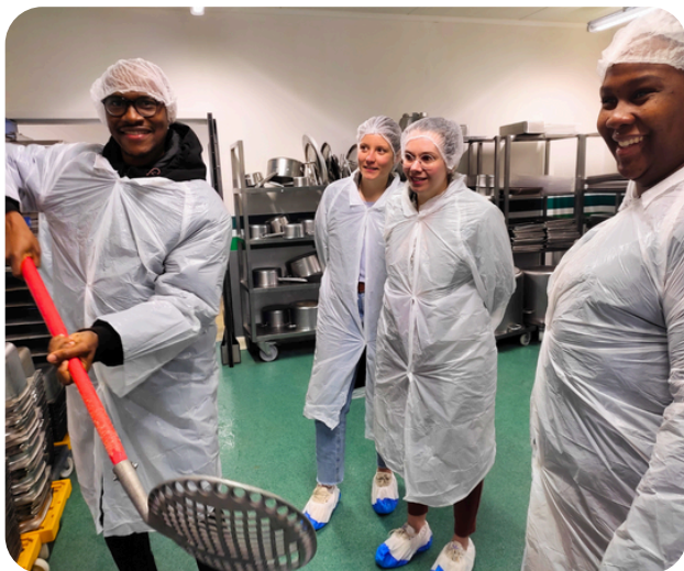
Visite de Restoria - Action FACEMPLOI

Afin de favoriser le lien avec les entreprises du territoire, un travail renforcé avec les partenaires prescripteurs s'est opéré afin de co-construire les actions ensemble au profit des bénéficiaires.