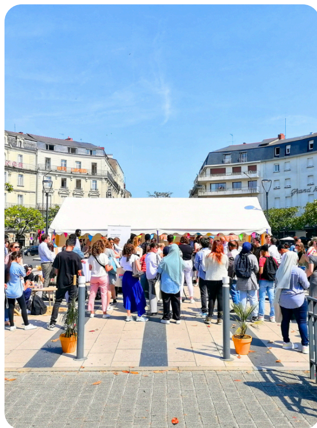
Train de l'Emploi à la gare d'Angers

La clôture de l'action s'est déroulée à la gare d'Angers où les rencontres ont pu continuer entre participant.e.s et représentant.e.s d'entreprises.