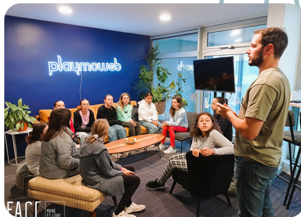
Visite Wi-Filles chez Playmoweb

A destination des jeunes de 16 à 25 ans, il s'agit de deux mois de parcours pour réfléchir à son projet professionnel, identifier ses envies, ses compétences et savoir être. Aller vers les professionnel.le.s, et entrer dans le monde de l'entreprise via des rencontres, des visites, des simulations d'entretien, etc. Le but est de retrouver une formation, un apprentissage, un service civique ou un emploi. En 2023, il y a eu trois sessions d'une dizaine de jeunes participants.