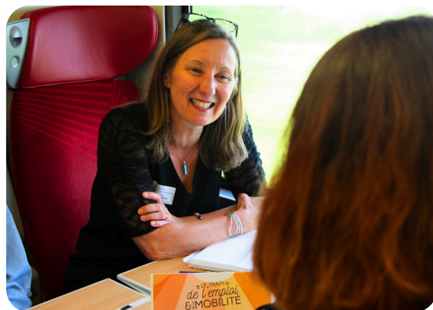
Rencontres entre jeunes et professionnel.le.s