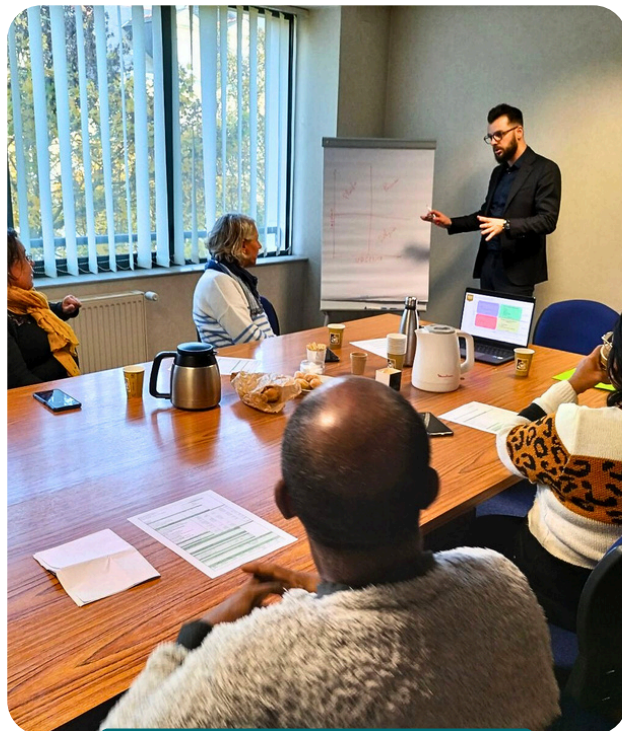
Atelier de lecture du bulletin de salaire

De manière générale, il s'agit d'opérer une coordination transversale permettant de fédérer les professionnel.le.s ayant besoin de lien avec l'entreprise.