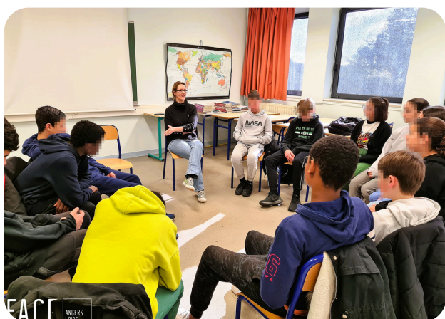
Intervention de professionnels en classe

Renforcer l'égalité des chances dans l'Education, valoriser les métiers et les filières