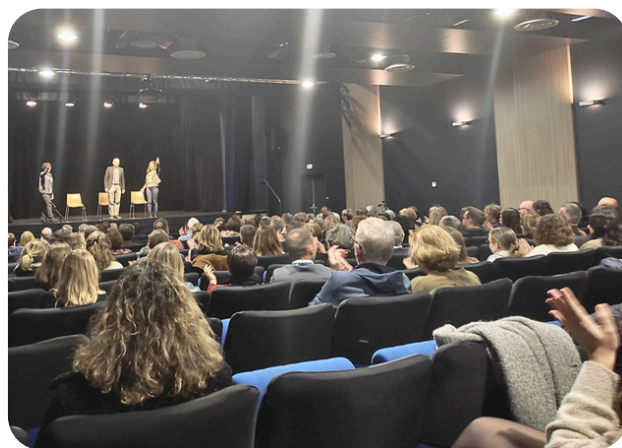
Pièce de théâtre "Un employé nommé désir"