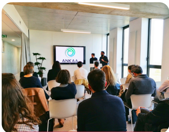
Rdv des Pitches qui nourrissent votre RSE

Développer l'engagement sociétal des entreprises et les accompagner dans la mise en œuvre d'actions à impact sur le territoire