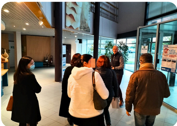
Visite de la CCI à des référent.e.s emploi

En effet, afin de répondre au mieux aux enjeux de l'accompagnement socio-professionnel, notre soutien s'est matérialisé par la mise en place d'événements à destination des référent.e.s prescripteur.rice.s afin de leur faciliter par la suite l'opérationnalité de leur accompagnement.