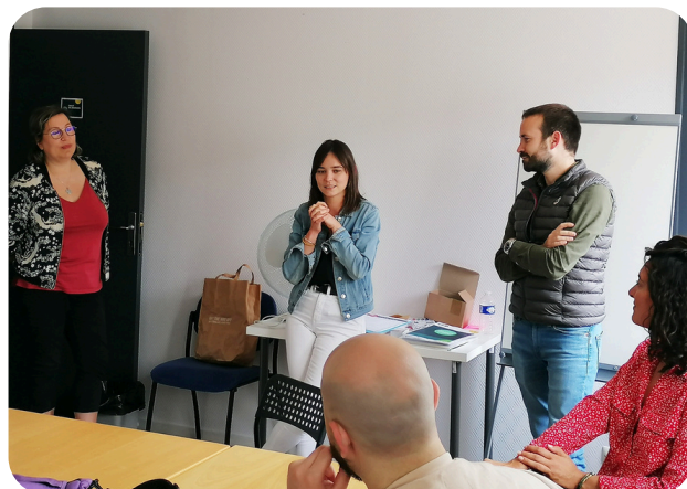
Atelier speed-meeting au Relais Pour l'Emploi